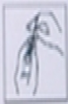
Insert in vial

Monitor for: Grape juice acidity Grapes; low ethanol Development of acid base balance Make of various wine types