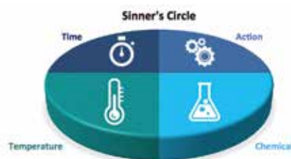
Fig. 2 – Sinner's cirkel viser den dynamiske sammenhæng, der er mellem tid (time), temperatur (temperature), koncentration (chemical) og behandlingens grundighed (action).

Samtidig med den antibakterielle effekt har sulfit også en antioxidantvirkning, hvor ilt vil reagere med sulfit og danne sulfat i stedet. Det dannede sulfat vil så ikke længere hverken have en baktericid eller en antioxidantvirkning længere. Det betyder, at man løbende under vinificeringsprocessen bør tilsætte nyt sulfit, hvis ilt kommer til ved f.eks. omstikning eller flaskefyldning. I visse tilfælde kan tilsættes lidt ascorbinsyre (Vitamin C), som har en mere langtidsvirkende antioxidant virkning, mens en mere landtidsvirkende antibakteriel virkning vil kræve andre konserverende stoffer, som normalt ikke tilsættes vin. Indholdet inde i flasken skulle gerne være bakteriefrit fra den afsluttende sulfittilsætning, og samtidig hjælper alkoholinholdet og den sure