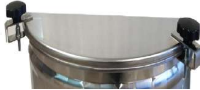
KIT4G - KIT6G