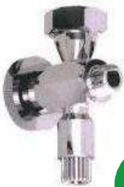
rubinetto di livello