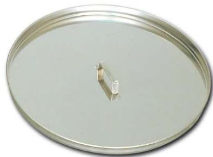
2382 – 2383 – 2384 – 2385 – 2387