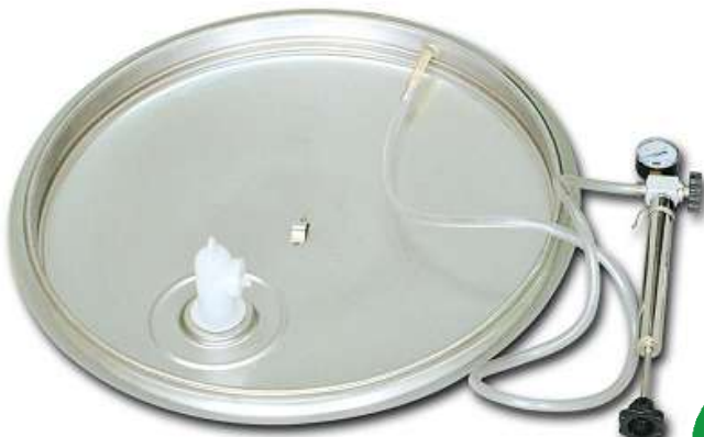
galleggiante a camera d'aria