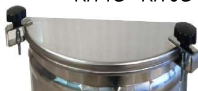
KIT4G - KIT6G