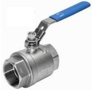
2412FF – 2411FF